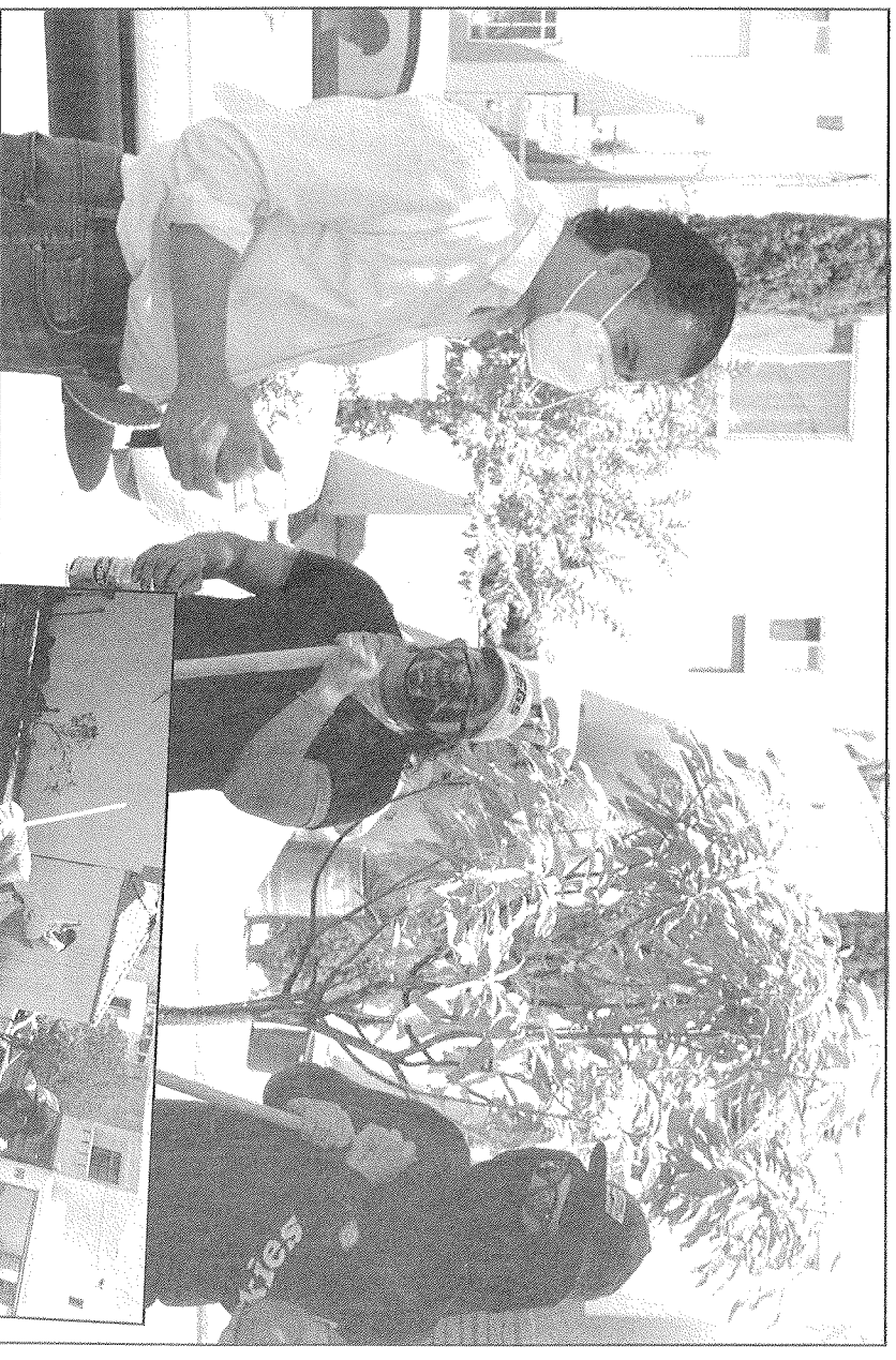
El alcalde recorrió las plazas del municipio donde se realizan trabajos.

“Estamos ahorita en una pandemia llevamos varios meses en nuestras casas y si tienes la necesidad de tener una percepción económica y quieres ayudar a tu colonia y municipio inscribete a este programa y vamos hacer las cosas juntos y mejores”, puntualizó Benavides Villarreal.